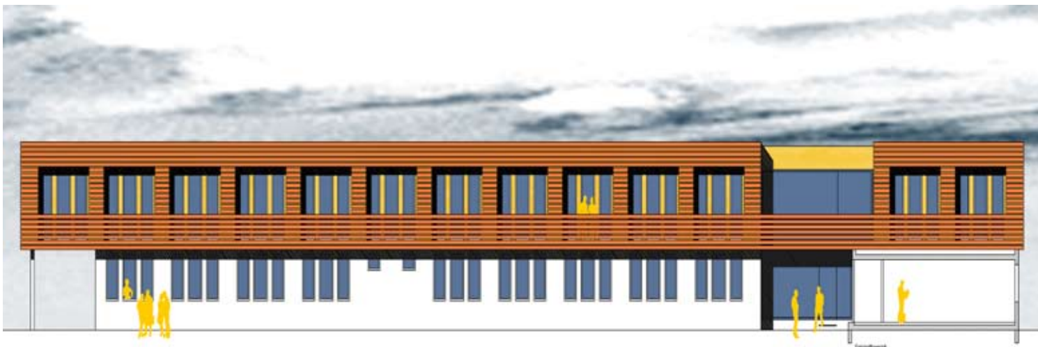
Gebäudeansicht - Wettbewerbsentwurf