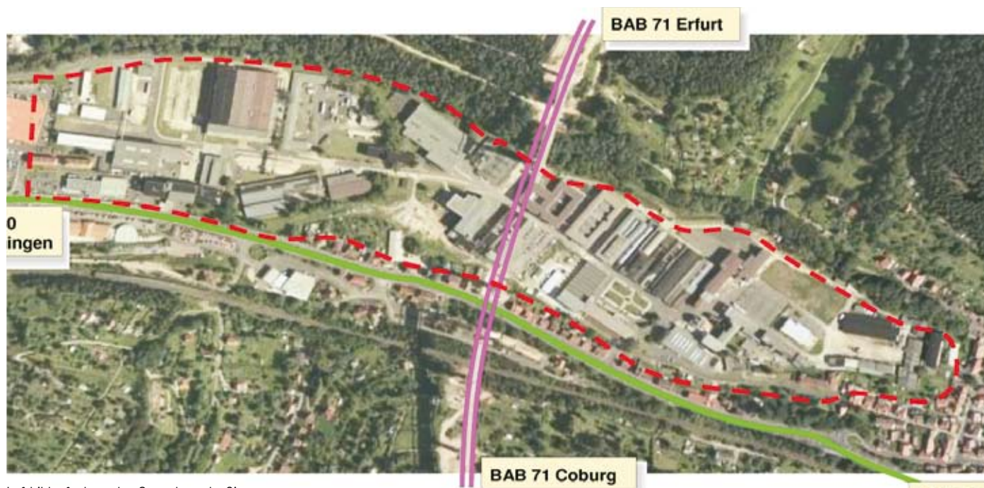
Luftbildaufnahme des Gewerbeparks Simson