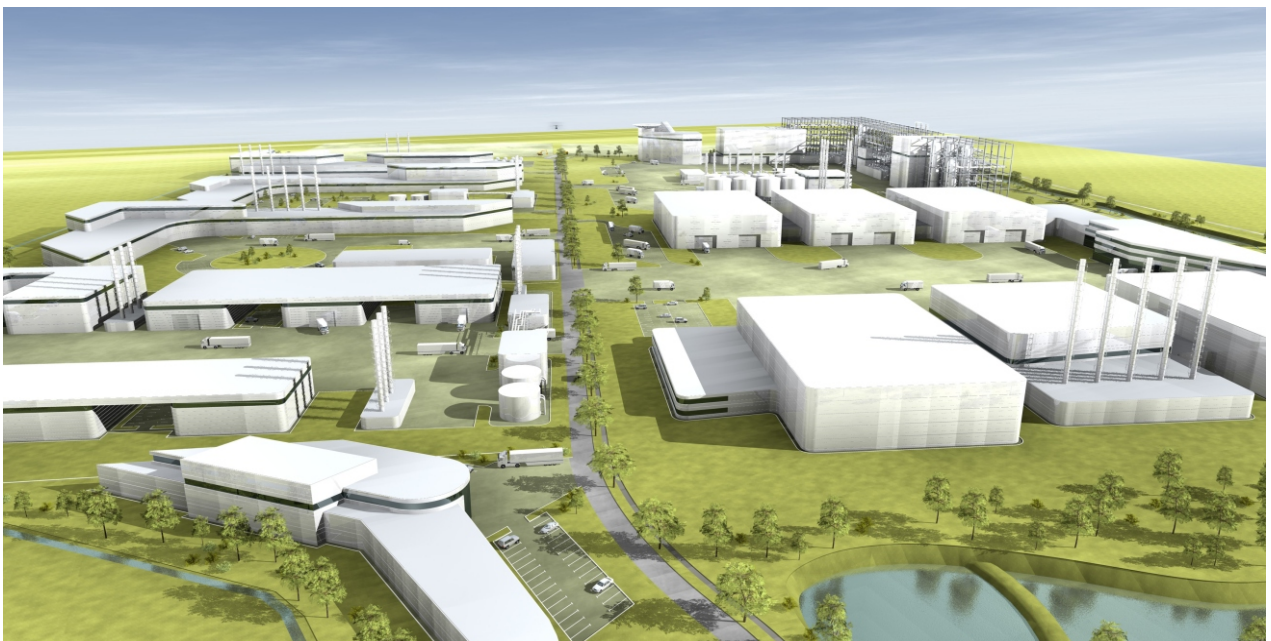
Perspektive über das gesamte Erschließungsgebiet