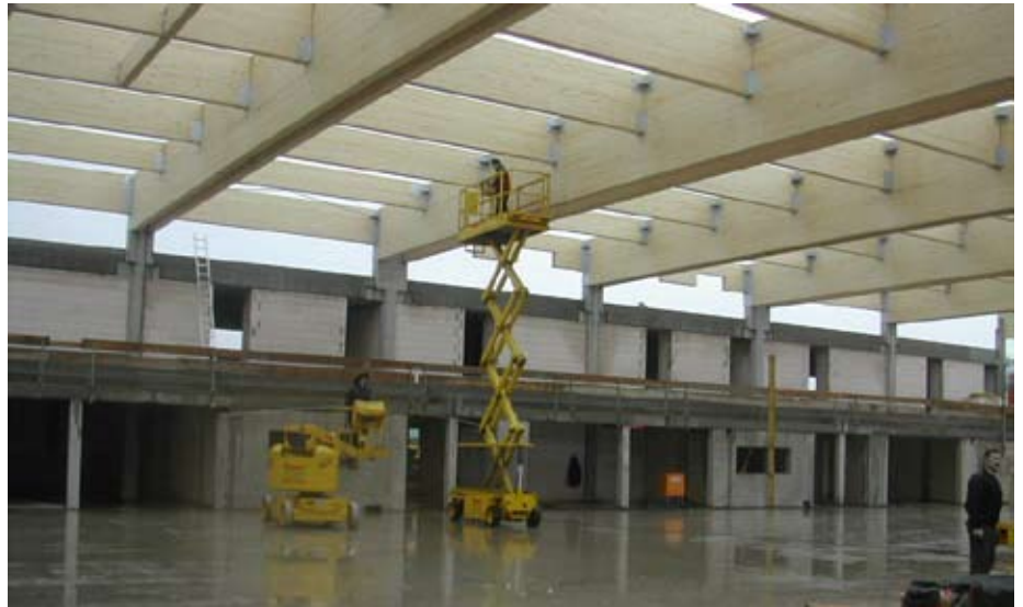
Montage der 33meter langen Dachbinder für das Hallentragwerk

Für ein Projekt, das am Ende viel mehr hermachen wird als das vorhergehende vergleichbarer Größe, freut sich Porsch: „Die neue Kanalisation hat zwar genauso viel gekostet, aber am Ende hat man 120 Kanaldeckel und zur Einweihung musste man den Bürgern auch noch das Geld für die Erschließungsgebühr aus der Tasche ziehen“. In der Turnhalle gab es stattdessen den Richtschmaus.