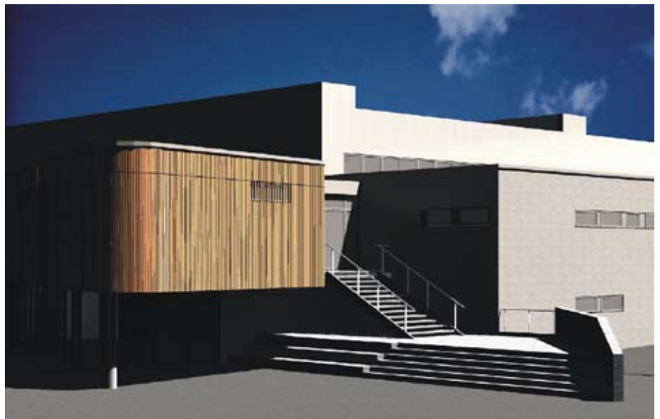
Perspektive der Eingangssituation und des Foyers der Dreifachsporthalle