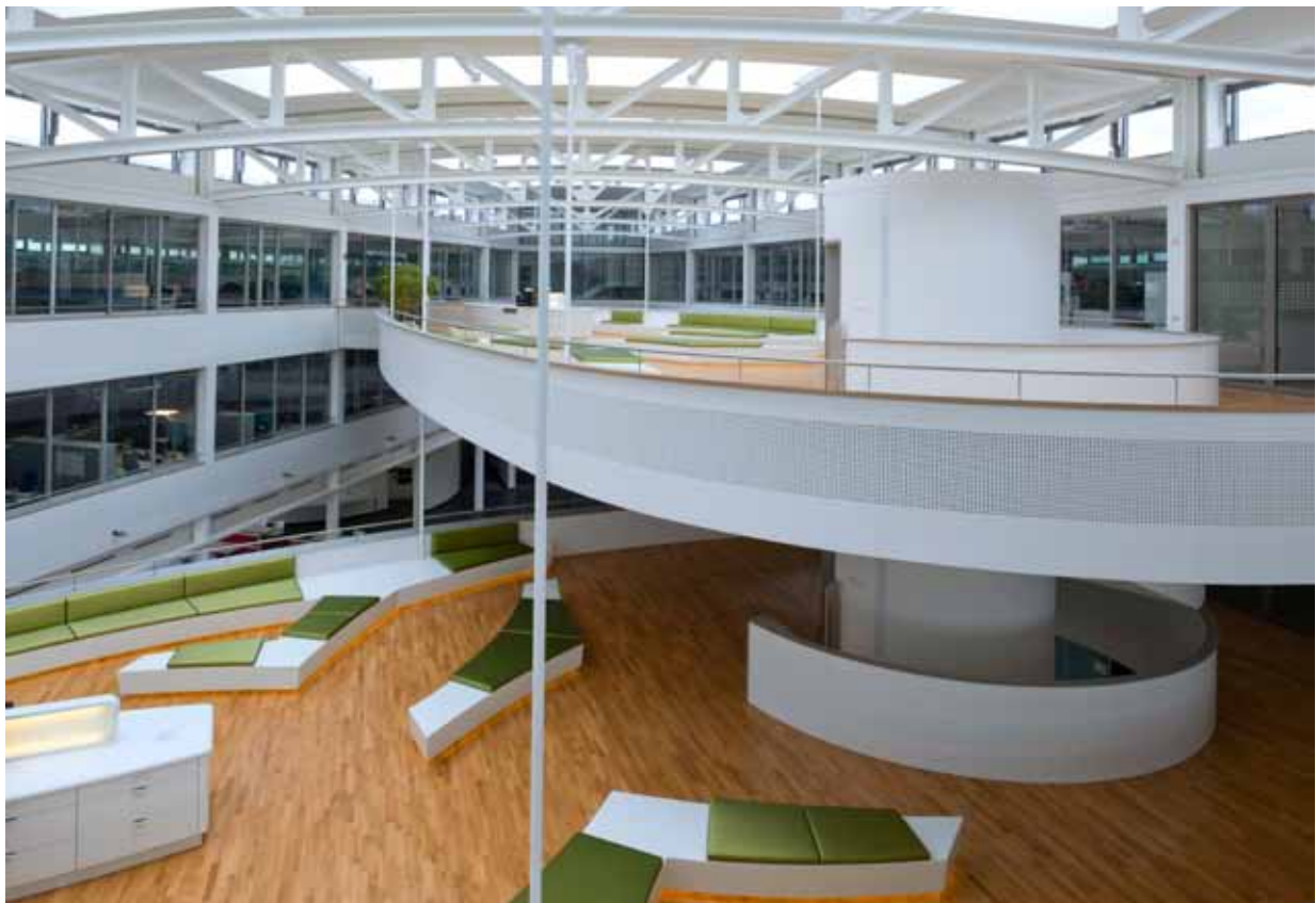
Vernetzung der * Ideeninseln *