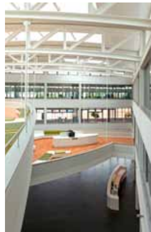
Foyer mit Meetinginseln

Auftraggeber Freudenberg Unternehmensgruppe [ Vileda ]