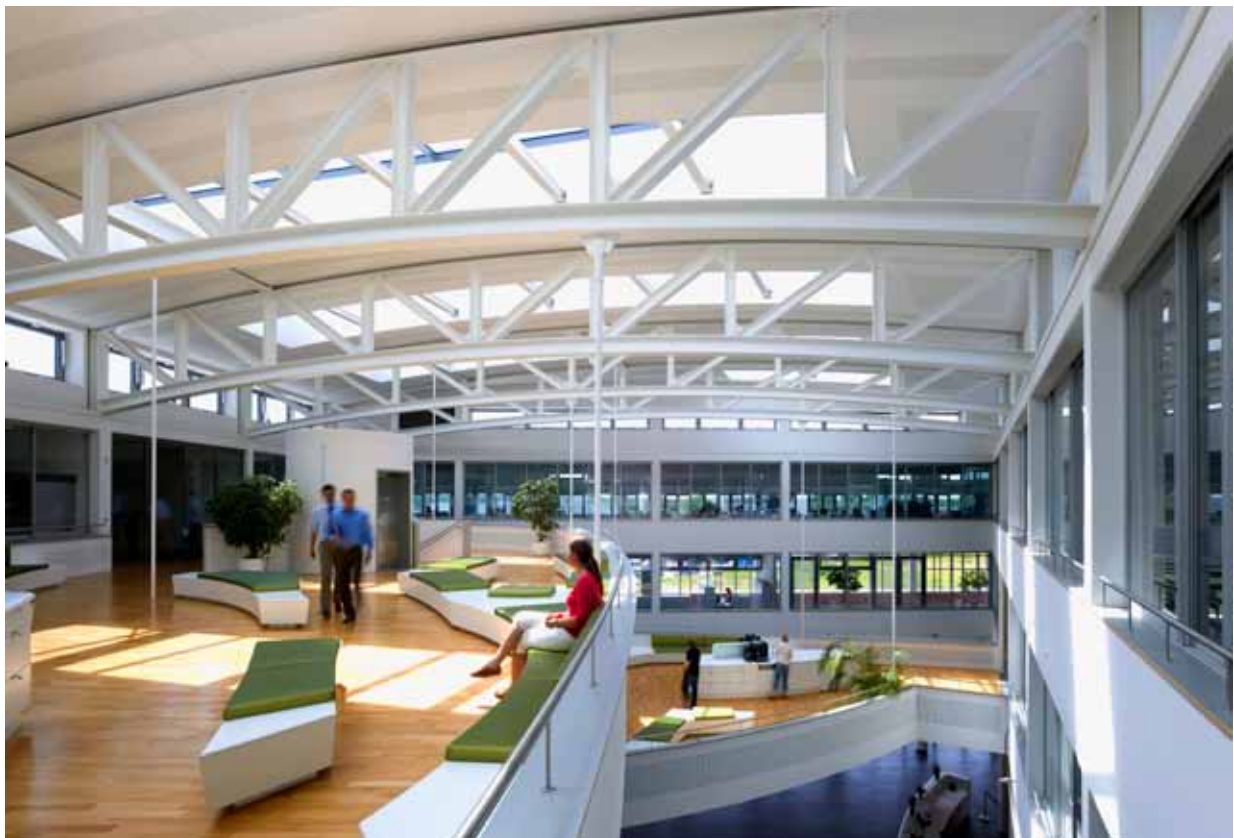
* Ideeninsel * + Lounge